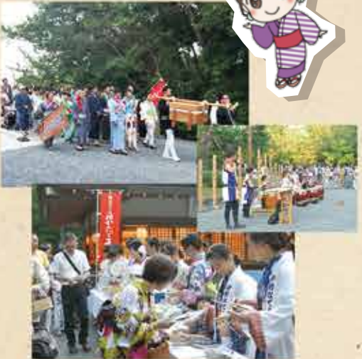
記念品は外宮 神楽殿前にて!