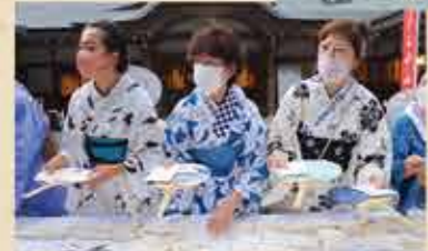
記念品は外宮 神楽殿前にて!