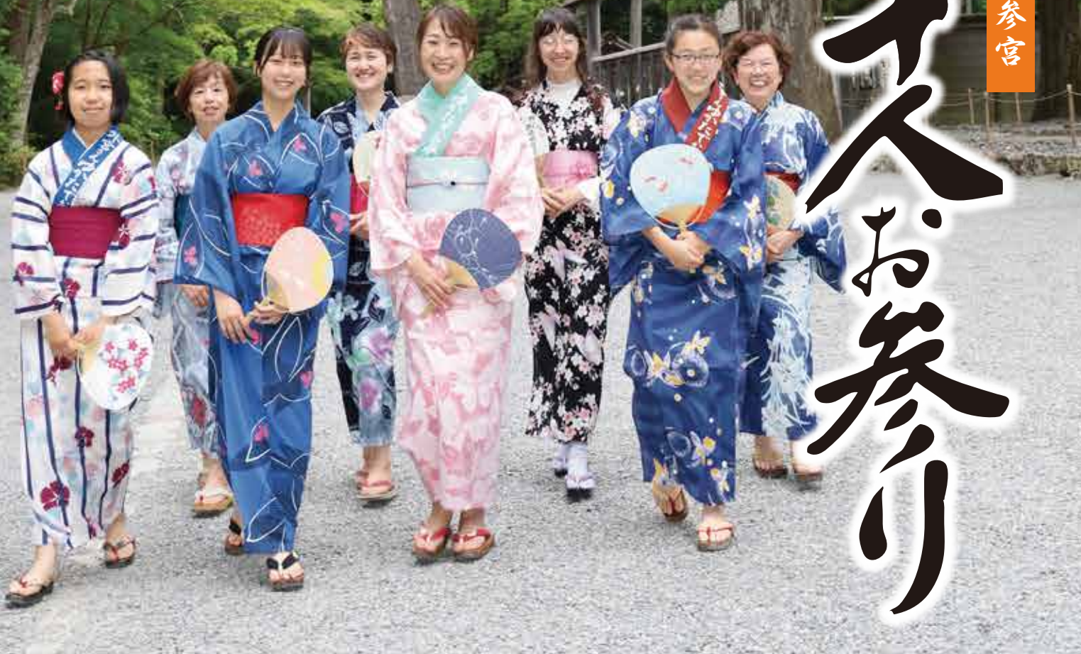
本町春木太鼓の皆さん